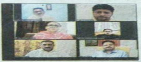
वैबीनार के दौरान मौजूद वक्ता।

मई • वक्ताओं ने कोरोना महामारी का भारतीय अर्थव्यवस्था पर पड़ने वाले प्रभावों पर विचार व्यक्त किए