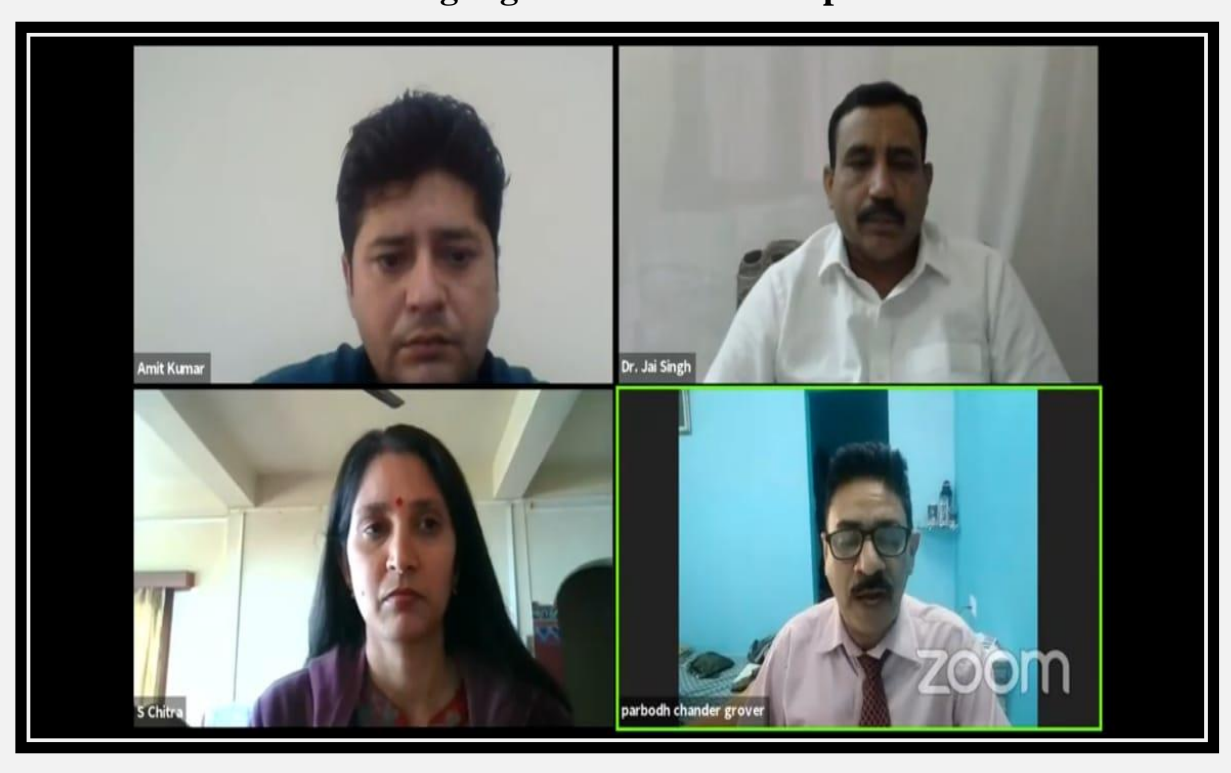
Highlights of the Workshop

https://www.youtube.com/watch?v=YGhKj4cEu3I