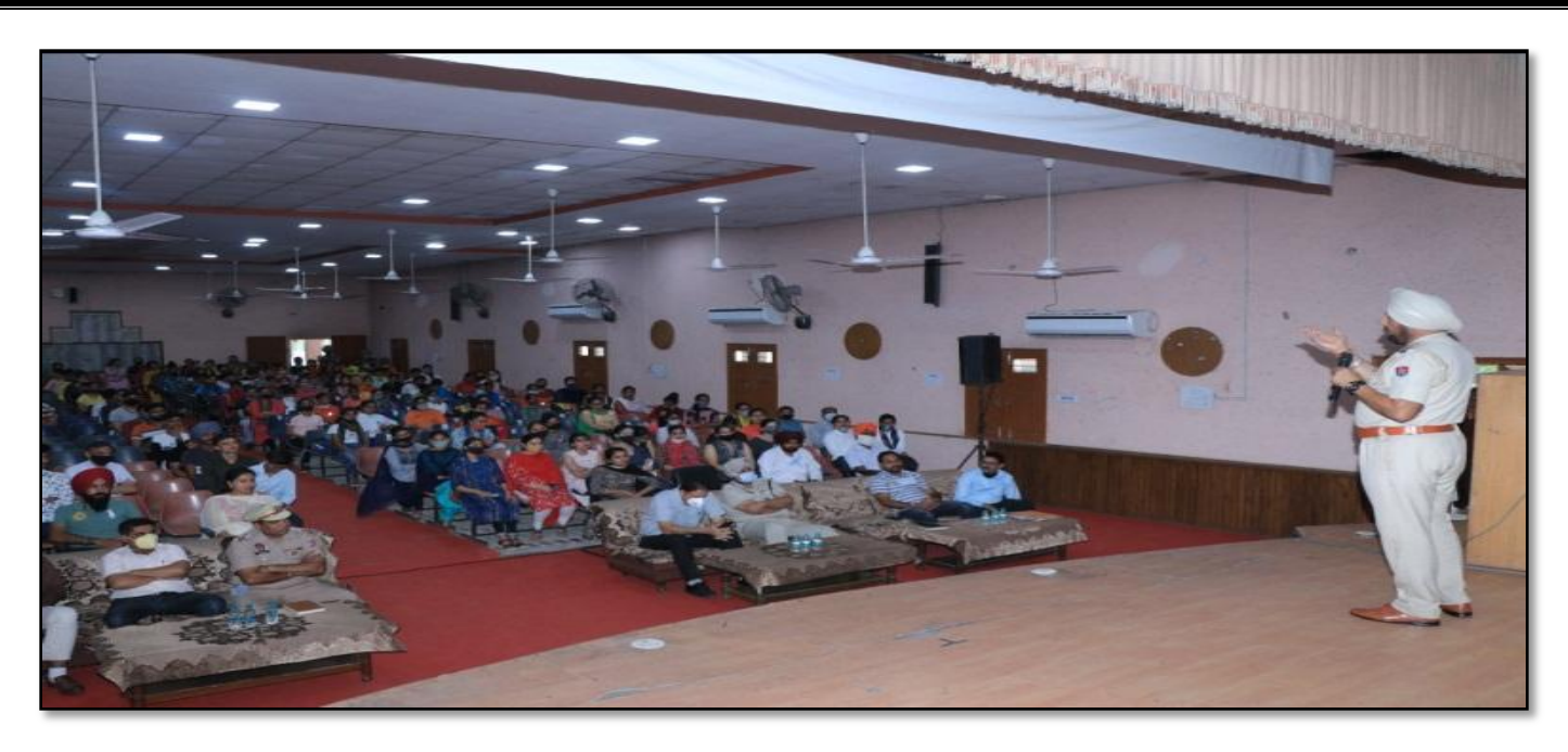
Celebration of Kargil Vijay Diwas organized by PG Department of History in collaboration with Shaheed SainikPariwar Suraksha Parishad, Punjab on 26<sup>th</sup> July, 2021